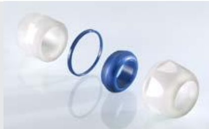
Abb. 2 Fig. 2

Polyamid Inkl. Unterlegscheiben Metrisches Gewinde EN 60423 Schutzart IP 68 bis 15 bar, IP 69K