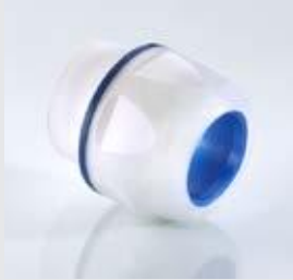
Abb. 1 Fig. 1