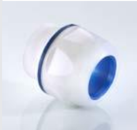
Abb. 1 Fig. 1