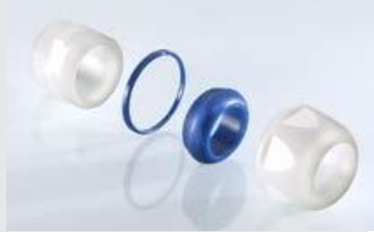
Abb. 2 Fig. 2

Polyamid Inkl. Unterlegscheiben Metrisches Gewinde EN 60423 Schutzart IP 68 bis 15 bar, IP 69K