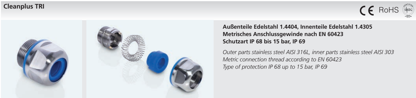
Abb. 1 Fig. 1 Abb. 2 Fig. 2 i Anschlussgewinde mit 15 mm Länge auf Anfrage Long connection thread 15 mm on request